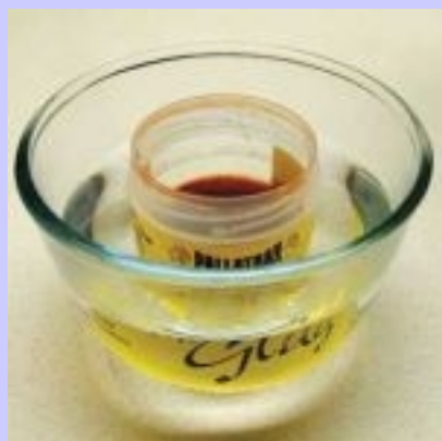
1 Il glug è termosensibile, molto appiccicoso ed idrosolubile

Come si usa "the glug" ??.. Segui attentamente tutti i passaggi illustrati nelle 6 foto gentilmente fornite da Pallatrax