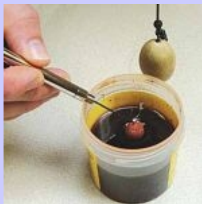
2 Immergere con l'aiuto di un ago la 'boilies' nel glug