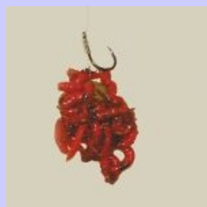
6 Si può fare con tutto! ...Anche con i bigattini.