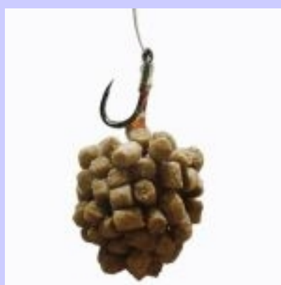
5 Ecco il risultato!